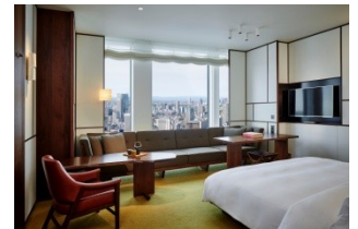
アンダーズ 東京宿泊券 など

当選賞品：アンダーズ 東京宿泊券、HILLS CARD お買い物券 1,000円分 など ※虎ノ門ヒルズおおかわら歯科医院、アンダーズ 東京(ヒブ以外)のご利用はスタンプ対象外。 ※キャンペーン内容は予告なく変更となる場合がございます。予めご了承ください。