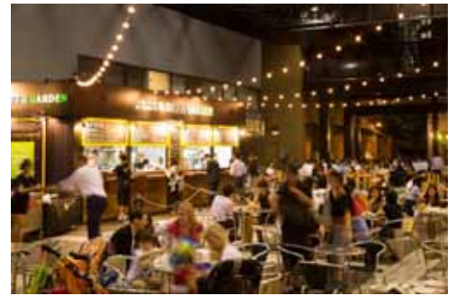
(写真は過去開催の様子)

『YONA YONA BEER GARDEN in ARK Hills』は、日本を代表するエールビール“よなよなエール”や、“水曜日のネコ”など、ヤッホーブルーイングの6種類の人気ビールがドラフトで楽しめるビアガーデンです。今年も、本ビアガーデンのために特別醸造した、 アークヒルズ限定クラフトビール「ARK Hills Ale 2017」 が登場。ビール好きにはたまらないラインナップで展開します。