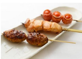
【六本木 百鳥】 春の串焼き 3 本セット