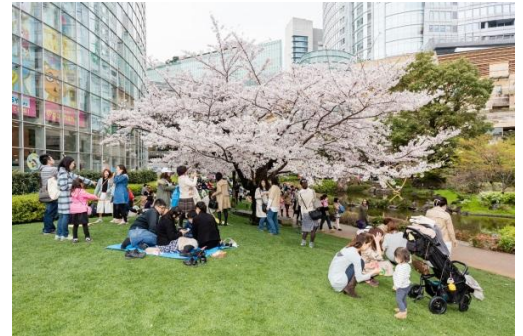
六本木ヒルズ内で都心型お花見体験

お花見やピクニックなど、春の行楽シーズンに屋外で食べたい定番メニュー「サンドウィッチ」。春の心地よい風を感じながら味わうサンドウィッチは格別の美味しさです。今回は17のレストラン・カフェが六本木ヒルズらしい様々なパリエーションを展開。“六本木ヒルズで春を見つけよう”をテーマに、フォトジェニックでSNSにアップしたいボリューム満点のサンドウィッチから、異食材を使用した変わり種サンド、別腹で堪能したいスイーツサンドまで、豊富なラインナップでお届けします。この春は、六本木ヒルズの美しい桜を眺めながら、家族や恋人、友人や同僚など、大切な人と一緒に楽しいお食事の時間をお過ごしください。