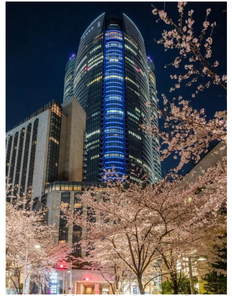
六本木ヒルズ森タワーと桜並木のコラボレーション