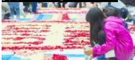
【参加型イベント】インフィオラータ