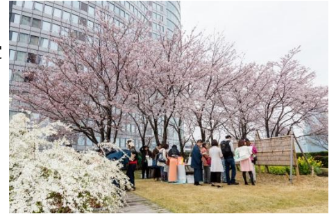
屋上庭園オープンガーデン

※未成年者は保護者同伴のご参加に限ります。 ※荒天の場合は中止になる場合がございます。