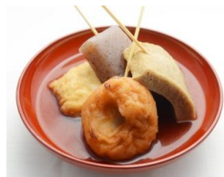
【人形町 田酔】 飛魚出汁 おでん盛り合わせ