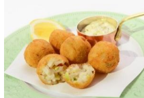
【グランド ハイアット 東京】 枝豆とコッパハムのアランチーニ