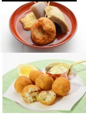
春を感じる屋台グルメ