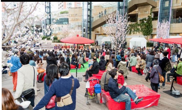
都心でお花見体験！春まつり2017