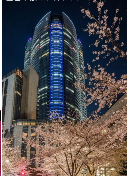
圧巻！桜のライトアップ