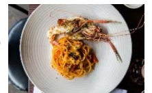
フラテリパラディソ

飲食では、シドニー発のイタリアンダイニング「フラテリパラディソ」の国内1号店がオープン。また、「ジャン=ポール・エヴァン」は現区画の約3倍の面積に客席スペースを設け、カフェ併設の店舗としてリニューアルします。