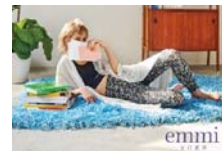
エミ ウェルネス クローゼット

2月下旬から3月上旬にかけて、モード感の高いレディスファッション3店舗を新規導入します。「アンティグラヴィテ マルシェ」は、ファッションを自由に楽しみたい大人の女性向けリラックス感のあるモード服を、「フレイ アイディー」は、次世代のニューモードキャリアを提案。また、「パラノイア パラディーソ」は、枠にとらわれない自由な女性を美しく見せるカジュアルスタイルを提供します。