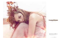
コスメキッチン ビューティー

また、本館B2Fには、現代をアクティブに生きる女性に向けて、「ウェルネス&ビューティ」をコンセプトに、ライフスタイルを提案する3店舗の複合業態『ウェルネス ラウンジ』が新たにオープンします。「コスメキッチン アダブテーション」は、CLEAN EATINGをコンセプトに、厳選素材を使用したメニューを提供するオーガニックレストラン。世界中からラインナップしたオーガニックコスメを展開する「コスメキッチン ビューティー」や、都会で生活する女性のクローゼットをイメージしウェルネススタイルを提案する「エミ ウェルネス クローゼット」も登場します。