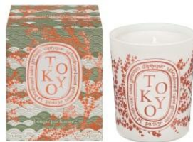
diptyque 商品名:フレグランスキャンドル Tokyo 価格:未定

最高の気分になれる「ルージュ ディオール」より、「キンザ」からインスピレーションをうけた限定品が誕生します。 ※写真右下