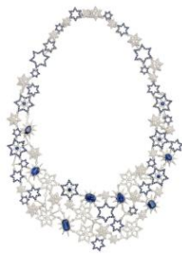
Bijou de M 商品名:Blue Stars Necklace 価格:16,000,000 円(予定)

夜空の輝く星たちをそのままネックレスにしたアイテム。光り輝く星空をブルーサファイアとダイヤモンドを贅沢に使用して表現しています。