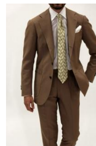
RING JACKET MEISTER GINZA 商品名:RING JACKET MEISTER206 英国 VINTAGE FABRIC スーツ 価格:250,000 円

1954 年に大阪で創業した高品質なメンズクロージングを展開する RING JACKET。既製品では取り入れない上着上衿の後かぶせ工程によって極上の着用感を実現。