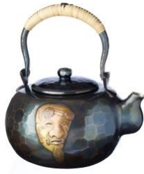
玉川堂 商品名:湯沸 口打出 翁面(2.7L) 価格:900,000 円

新潟県無形文化財に指定されている鋳起銅器(ついぎどうき)の技術を駆使した作品。GINZA SIX内に能楽堂が完成することを縁とし、伝統芸能と伝統工芸の融合を表現しました。 サイズ:胴高 17×胴張 20.5cm 素材:銅