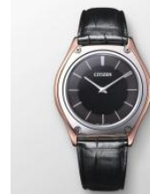
CITIZEN FLAGSHIP STORE TOKYO 商品名:Eco-Drive One CITIZEN FLAGSHIP STORE TOKYO 限定セット 価格:750,000 円

サイズ:メンズ XS~XL レディース XS~XL 素材:コットン100% カラー展開:ブラック