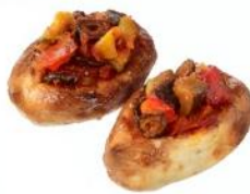
TAKAZAWA 180 ICHI HACHI MARU 商品名:バイクンコロケ ～季節の野菜のラタトゥイユ～ 価格:400 円～※季節により変動

フランスの伝統菓子「クイニー・アマン」と「タルトタン」を合わせました。バターと砂糖で煮詰めたりんごをバターをたっぷり織り込んだフリオッシュフィユテで包み、カラメルでコーティングしました。