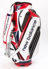
the HOUSE 商品名:<NEW BALANCE>"TOUR CADDIE BAG" GINZA SIX LIMITED EDITION 価格:52,000 円

新潟県無形文化財に指定されている鋳起銅器(ついぎどうき)の技術を駆使した作品。GINZA SIX内に能楽堂が完成することを縁とし、伝統芸能と伝統工芸の融合を表現しました。 サイズ:胴高 17×胴張 20.5cm 素材:銅