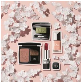
Dior BEAUTY GINZA 商品名:ルージュディオール#872 "GINZA" 価格:4,200 円

最高の気分になれる「ルージュ ディオール」より、「キンザ」からインスピレーションをうけた限定品が誕生します。 ※写真右下