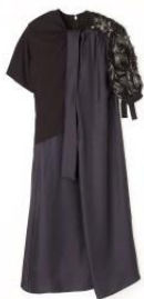
Maison Margiela 商品名:エンプロイダリードレス 価格:292,000 円

わずか 1mm 厚のムーブメントを内包する、世界最薄の光発電時計。限定セットには、つややかで風格のあるデジュー革の替えバンドをセットし、朱色の漆の箱で提供いたします。