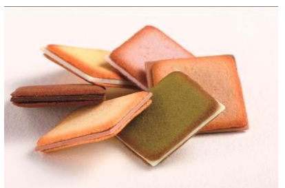
ISHIYA GINZA 商品名:SAQU LANGUES DE CHAT (サク ラング・ド・シャ) 価格:1,200 円

北海道で培われたラング・ド・シャ製造の技術を活かし、「銀座の手土産」にふさわしいラング・ド・シャとチョコレートとの組合せを厳選した「SAQU」シリーズ。北海道チーズ、北海道赤ワインなど、6種類をご用意しました。 内容量:12 枚入り