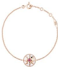
House of Dior Ginza 「Rose des Vents (ローズ デ ヴァン)」

中央通りに並ぶ路面 6 店舗(House of Dior Ginza、CÉLINE、SAINT LAURENT、Van Cleef & Arpels、VALENTINO、FENDI)では、ラグジュアリーで個性溢れる GINZA SIX 特別商品を展開します。世界最大級のコレクションを展開するシチズン、創業 120 年の着物製作所 OKANO、新潟燕三条の鋳起銅器専門店 玉川堂などでは、老舗ブランドならではの匠の技と「銀座」をかけあわせた、モダンかつ品格高い特別商品を販売します。また、フランススイーツ界の巨匠 フィリップ・コンティチーニ氏や、人気シェフの高澤義明氏は、それぞれの店で、世界中の美食家を魅了するグルメを販売するなど、各店渾身の特別商品が多数出揃い、GINZA SIX 開業を盛り上げます。