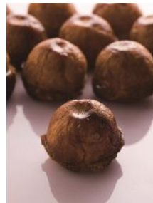
PHILIPPE CONTICINI クイニー・タタン

※特別商品のラインナップは次頁以降および別紙資料をご覧ください。価格は全て税抜です。 ※販売数量、販売方法等の詳細は各ブランドにお問い合わせください。 ※レストランの限定メニュー/特別メニューは3月中旬にリリース配信予定です。 ※記載情報は2017年2月14日時点の情報です。発売までに情報が変更される可能性があります。