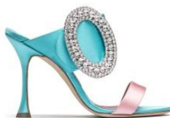
MANOLO BLAHNIK 商品名:FIBIONABI 価格:133,000 円

スワロフスキーを贅沢に使った大きいオーバル状のバックルが足元を美しく輝かせます。19 世紀後半に活躍した世界で最初のオートクチュール・デザイナー「チャールズ・ワース」からインスピレーションされた、ラグジュアリーファッションシューズと呼ぶにふさわしい一足です。