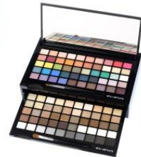
shu uemura 商品名:100色 アイシャドウ パレット 価格:未定

日本庭園からインスピレーションを受け調和と静けさのバランスが絶妙なアイテム。近くの神社からの香りが落ち着きを与えてくれるヒノキの木陰の散歩を連想させるキャンドルです。 内容量:190g