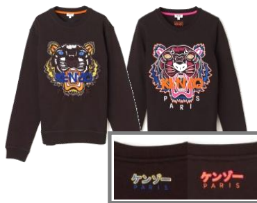
KENZO 商品名:タイガースウェット 価格:36,000 円

限定カラーのタイガー刺繍。バックの首元にはカタナの「ケンゾー」ロゴ刺繍入りの GINZA SIX だけのスペシャルスウェットです。