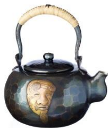
玉川堂 湯沸 口打出 翁面(2.7L)