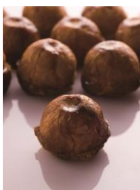
PHILIPPE CONTICINI 商品名:クイニー・タタン 価格:450 円

フランスの伝統菓子「クイニー・アマン」と「タルトタン」を合わせました。バターと砂糖で煮詰めたりんごをバターをたっぷり織り込んだフリオッシュフィユテで包み、カラメルでコーティングしました。