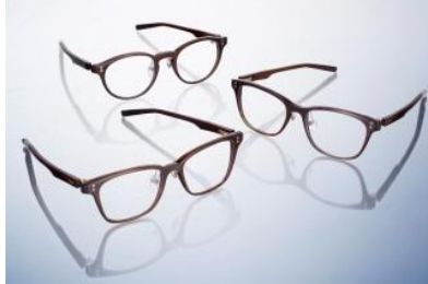
Four Nines 商品名:GINZA SIX オープニングモデル バッファローホーンフレーム 価格:170,000 円(予定)

天然素材のバッファローホーンを使用した GINZA SIX オープニングモデル。「逆 R ビンジ」など独自の高い機能性を活かしたつくりで、上品さも楽しめます。