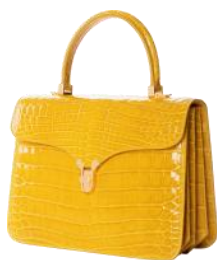
KWANPEN 商品名:折り紙ハンドバッグ 価格:700,000 円(予定)

サイズ:メンズ 44,46,48,50 素材:モヘア×ウール カラー展開:ベージュのみ