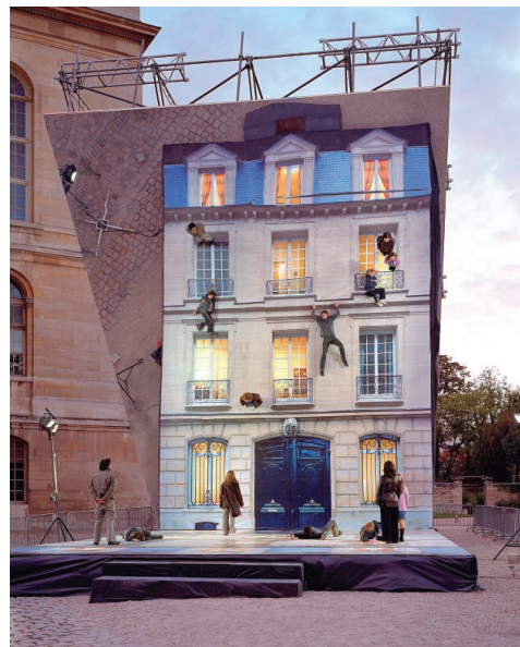
レアンドロ・エルリッヒ 《建物》 2004年 写真、照明、金属、木材、鏡 800 x 600 x 1,200 cm 展示風景：「ニュー・ブランシュ」パリ、2004年