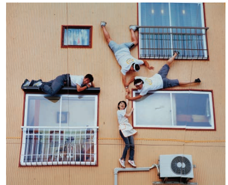
レアンドロ・エルリッヒ 《妻有の家》 2006年 写真、照明、金属、木材、鏡 800×600×1,200 cm 展示風景：大地の芸術祭 越後妻有アートトリエンナーレ2006、新潟、2006年