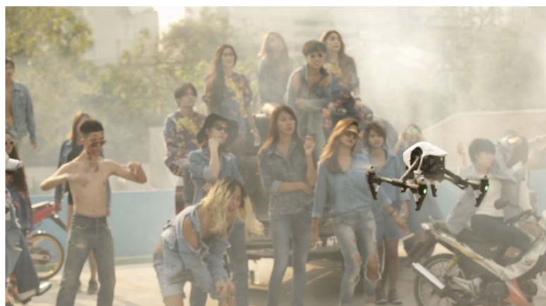
コラクリット・アルナーノンチャイ 《おかしな名前の人たちが集まった部屋の中で歴史で絵画を描く3》 2015年 ビデオ 24分55秒

*2016年11月現在、インドネシア、カンボジア、シンガポール、タイ、フィリピン、ブルネイ、ベトナム、マレーシア、ミャンマー、ラオスの10カ国が加盟