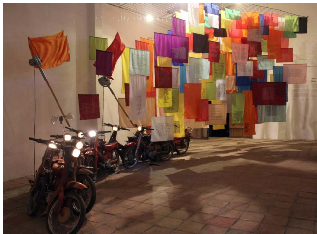
ジョンペット・クスウィダナント 《言葉と動きの可能性》 2013年 原動機のないモーターバイク、布旗 サイズ可変 所蔵：森美術館