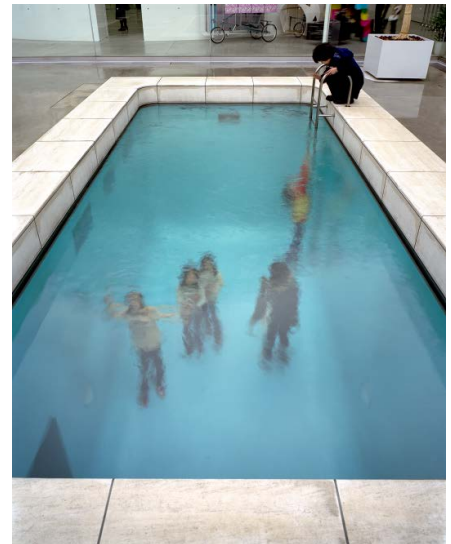
レアンドロ・エルリッヒ 《スイミング・プール》 2004年 コンクリート、ガラス、水 280×402×697 cm 所蔵：金沢21世紀美術館

本展は東京における初の大規模個展として、エルリッヒの24年にわたる活動の全容に迫ります。