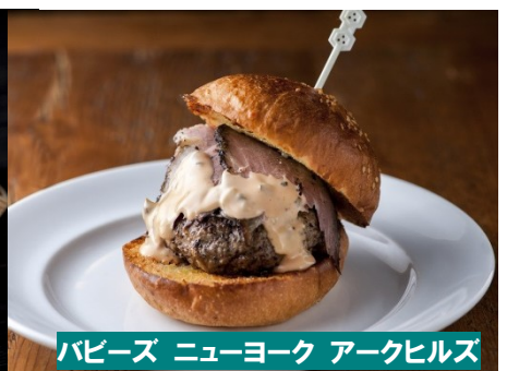
バビーズ ニューヨーク アークヒルズ