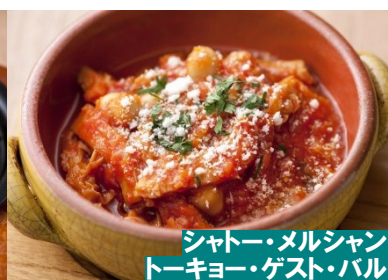
シャトー・メルシャン トーキョー・ゲスト・バル