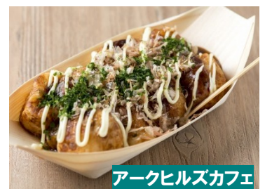
アークヒルズカフェ