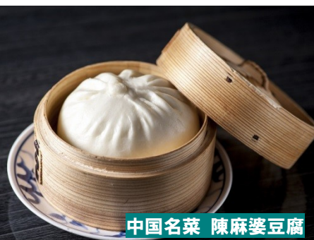
中国名菜 陳麻婆豆腐