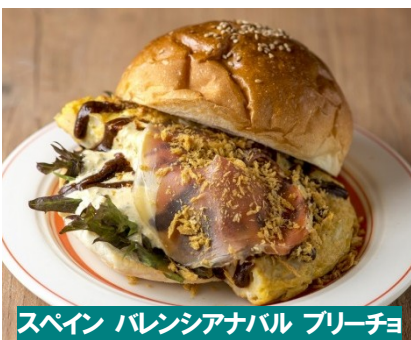
スペイン バレンシアナバル プリーチョ

がっつりとお腹を満たしたい方におすすめのボリューム満点肉メニューです。今年3月にアークヒルズにオープンした「スペインバレンシアナバル プリーチョ」からは、スペインの国民食である“ポカディージョ”をアレンジしたサンドウィッチを提供します。