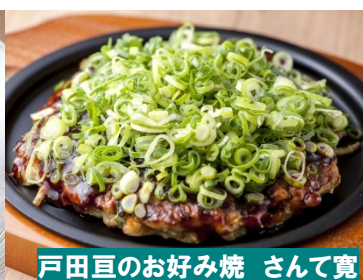
戸田亘のお好み焼 さんて寛