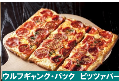
ウルフギャング・バック ピッツァバー