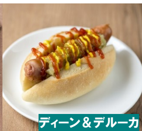
ディーン&デルーカ