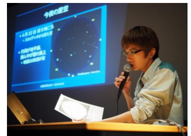
星空解説セミナーの様子