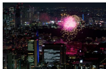
屋上「スカイデッキ」から望む神宮外苑花火大会(2015年)の様子