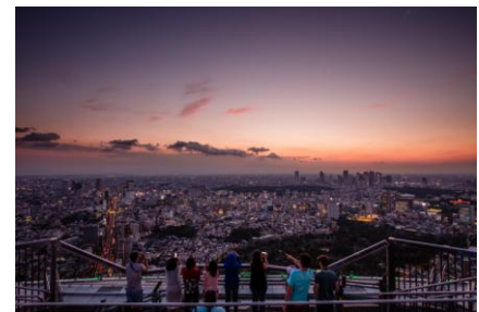
屋上「スカイデッキ」から望む夏の夕焼け