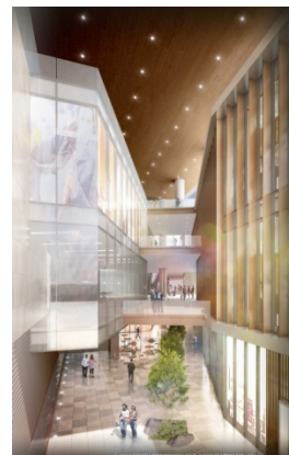
商業ゾーンイメージ

「東京ガーデンテラス紀尾井町」(東京都千代田区紀尾井町)は、約3haの敷地にオフィス、ホテル、商業施設、住宅、カンファレンスなどを擁した都内有数の大規模複合開発です。本プロジェクトを推進する西武プロパティーズは、2013年12月に締結した開業前のプロパティマネジメント業務委託に続き、開業後においても、大規模複合施設の運営実績が豊富な当社を事業パートナーとして選定しました。