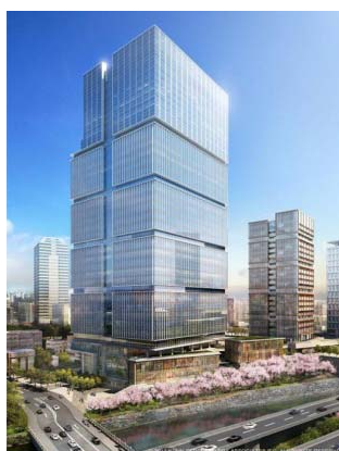
施設外観イメージ