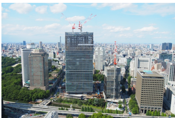
南側より (2015年9月14日撮影)

森ビル株式会社は、株式会社西武ホールディングスの連結子会社である株式会社西武プロパティーズが開発を手掛ける大規模複合開発プロジェクト「東京ガーデンテラス紀尾井町」(2016年5月頃竣工予定)の開業後5年間のプロパティマネジメント業務を受託しました。当社は、オフィスゾーンを中心とするプロパティマネジメント(PM)、ビルマネジメント(BM)、および街全体のタウンマネジメント等の業務をサポートしてまいります。