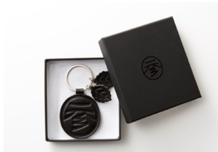
オリジナルキーホルダー