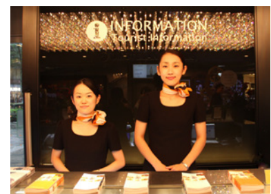
外国語対応スタッフ (表参道ヒルズ)

外国語対応(英・中・韓)が可能なインフォメーションスタッフを拡充し、言 語でお困りになっている海外のお客様のサポートを積極的に実施しま す。