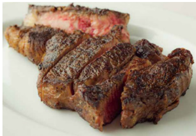
国産和牛等を用いた厳選肉メニュー (六本木ヒルズ)

森ビル株式会社が管理運営する六本木ヒルズや表参道ヒルズなどの各商業施設では、10月1日の中国の建国記念日「国慶節」に向けて、訪日中国人旅行者の中でも富裕層を対象に、買上額に応じたプレゼントや、国産和牛等を用いた限定の厳選肉メニューの提供などを実施します。