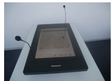
多言語自動翻訳機

未来の都市づくりにおける新たな事業や商品・サービスの創出を目的に、 パナソニック株式会社と実施している実証実験の一環として、「多言語 自動翻訳機」を導入します。外国人観光客が多く訪れる2施設のイン フォメーションにおける接客業務で実際に活用することで、自動翻訳機 の有用性の確認や改善点を抽出し、実用化に活かします。