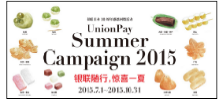
キャンペーンロゴ

※ヴィーナスフォートはステーションナリーの代わりに500円分のショッピン グチケットをプレゼント