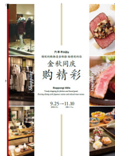
プロモーションチラシ