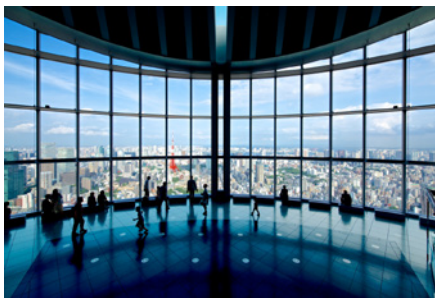
東京シティビュー