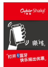
「Cyber Shake」キャンペーンロゴ

「WeChat(微信)」のシェイク機能を活用した情報取得サービス。施設内 に設置されたビーコン(Bluetooth 電波を発信する端末)付近でシェイク を行うと、フロアマップや割引クーポンなどが取得できます。