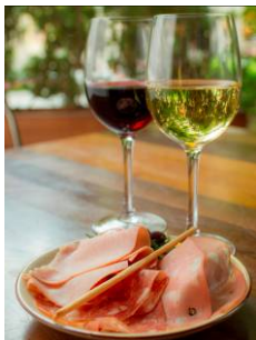
ジャン ジョルジュ 東京