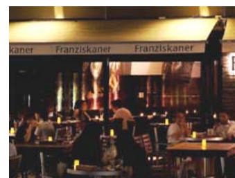
昨年店舗で実施したキャンペーンの様子