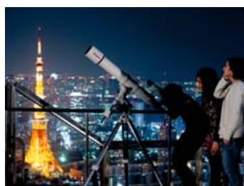
スカイデッキ星空観察会(イメージ)

ライトダウンキャンペーン期間中、六本木ヒルズやアークヒルズの一部店舗における「ハッピーアワープラン」のほか、海拔 270m、オープンエア形式の展望施設としては関東一の高さを誇る東京シティビュー「スカイデッキ」(森タワー屋上)では、ライトダウンにより暗くなった都心で星空観賞をお楽しみいただける「六本木天文クラブ スカイデッキ星空観察会」を、特別実施日に合わせ実施いたします。