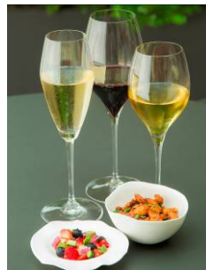
オーピカ モツアレラパー