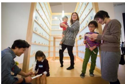
「おやこでアート：おやこでおしゃべりツアー」 ※森美術館、イメージ