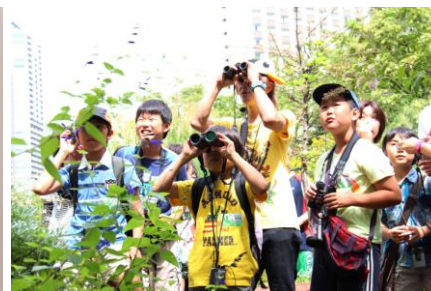
「バードウォッチングツアー」イメージ