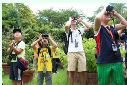
「野鳥の専門家と行くバードウォッチングツアー」過去の様子

様々な環境評価で最高ランクを取得するなど、生物多様性に配慮した豊かな植生と多くの生き物が育まれる虎ノ門ヒルズ、そして愛宕グリーンヒルズを舞台に、鳥の専門家「♪鳥くん（永井真人氏）」と一緒にバードウォッチングを行います。多様な小鳥や豊かな自然に触れ合いながら、生き物やみどりの大切さを学びます。どんな小鳥に出会えるかは当日のお楽しみです。