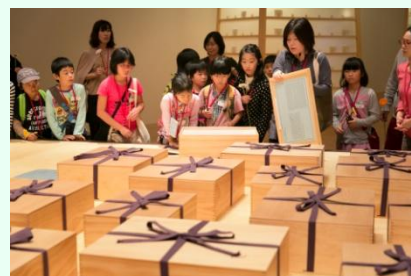
「アートと文化のヒミツ探検ツアー」過去の様子

「文化都心」をコンセプトにつくられた六本木ヒルズで、森美術館で開催する「シンプルなかたち展：美はどこからくるのか」を鑑賞した後に、六本木ヒルズ内にちりばめられたアート作品を鑑賞します。また“こどもの日”にピッタリの「シンプルなかぶと作りワークショップ」を実施し、沢山のアートに触れながらアートと街の関係を楽しみながら学びます。