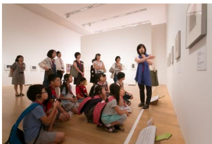
「アートと文化のヒミツ探検ツアー」イメージ