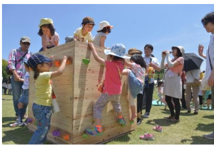
「木とあそぼう 森をかんがえよう with more trees」 ※アークヒルズ、イメージ