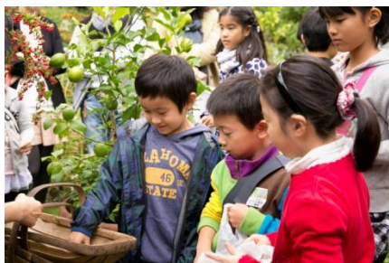
「環境とみどりのヒミツ探検ツアー」イメージ

森ビル株式会社は、この度、5月3日(日)、9日(土)、10日(日)の3日間、「ヒルズ街育プロジェクト」(※1)春のツアーを開催します。今回は、ゴールデンウィークならではの、“こどもの日(5/5)”にちなんだかぶと作りや“母の日(5/10)”のプレゼントとなる鉢植え作りのワークショップなどを盛り込んだ、3種類のツアーを実施。また、「ヒルズ街育プロジェクト」の他にも、六本木ヒルズ、アークヒルズ、表参道ヒルズなどの各施設においても、様々なキッズ向けワークショップを企画しており、4月下旬から5月下旬にかけて合計9種類のプログラムを開催します。