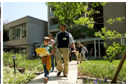
「ヒルズ いきもの WEEKS」 ※アークヒルズ仙石山森タワー、イメージ