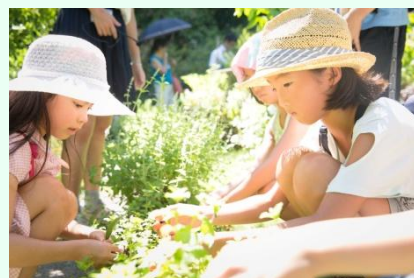
「環境とみどりのヒミツ探検ツアー」過去の様子

1986 年の開業から四半世紀以上の時をかけて、植物が立派に育ったアークヒルズで、豊かな自然と美しいみどりに囲まれながら街における環境とみどりの大切さを学ぶツアー。ハナマスやフロックスなど春の花が咲き誇る、普段は入ることのできないガーデンの見学を行います。また、“母の日”のプレゼントにもなる自然を体験出来るワークショップを実施し、様々な自然と触れ合いながら環境とみどりのヒミツを探ります。