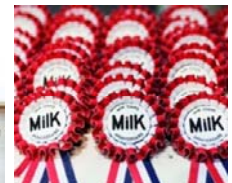
アニバーサリー ミルク