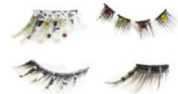
表参道ヒルズ限定カスタマイズ ラッシュ ※イメージ