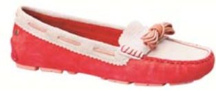
表参道ヒルズ限定商品(3/6販売開始)