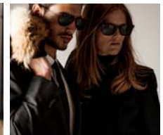
ティッピング ポイントッド トウキョウ