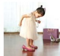
ババラ 表参道ヒルズ