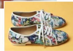
表参道ヒルズ限定商品 (3/7 販売開始)