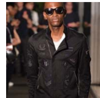
イイザ ローントーキョー

そして、「シュウ ウェムラ ビューティブティック 表参道ヒルズ本店」(西館 1F)は、プロフェッショナルメイクアップアーティストのアトリエを模した店舗デザインに大規模リニューアル。シープスキンブーツで有名な「アグ オーストラリア」(本館 B2F)は、店舗スペースを拡大し移転リニューアルします。