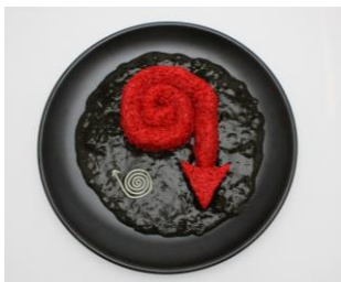
Guru Guru ブラックカレー 1,180円

パプリカ・チリパウダーで炊き上げたライスで、ティム・バートンの代表的なぐるぐるアイコンを表現したイカ墨カレーです。