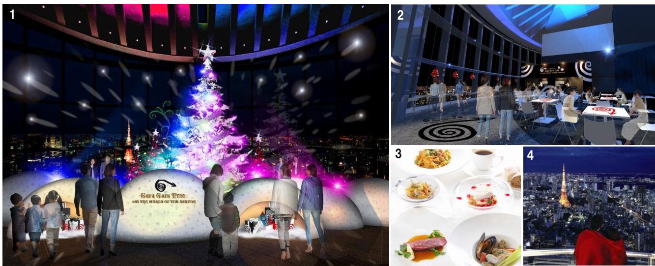
1.「Guru Guru Tree by THE WORLD OF TIM BURTON」(イメージ) / 2.コラボカフェ「J-WAVE Guru Guru Café with THE WORLD OF TIM BURTON」(イメージ) 3. レストラン「マドラウンジ」の『クリスマスディナー』 4. 「Love ブランケット」

東京シティビューでは、その他にもクリスマスデートにぴったりの様々なコンテンツをご用意しています。