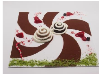
Guru Guru メガネのチョコレートプレート 1,080円

見た目はバーガー、中身はスパイスの効いたチリコンカンとぐるぐるソーセージを使ったホットドッグ。