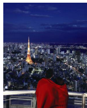
二人で包まる“Love ブランケット”

さらに、星空を気軽に楽しむことができる「六本木天文クラブ」では、12/14(日)「ふたご座流星群観測会」、12/22(月)「クリスマス特別“Love Love”星空観測会」を開催します。普段入ることのできないヘリポートに本格的な天体望遠鏡が設置され、専門家のレクチャーとともに星空観賞ができます。