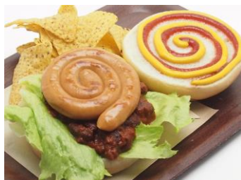
Guru ドッグ 1,180円

パプリカ・チリパウダーで炊き上げたライスで、ティム・バートンの代表的なぐるぐるアイコンを表現したイカ墨カレーです。