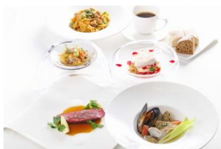
クリスマスディナーコース

※12月20日(土)~25日(木)のディナータイムは、クリスマスコースのみの営業となります。