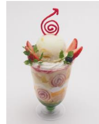
不思議な Guru Guru フルーツパフェ 1,080円