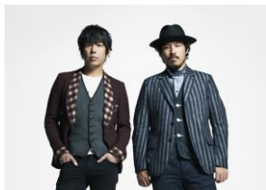
12/2(火)スキマスイッチ

今年も J-WAVE プロデュースによる豪華アーティスト出演のクリスマスライブ「J-WAVE CHRISTMAS LIVE @ TOKYO CITY VIEW」を開催。『サプライズ』を合言葉に珠玉のアーティストのライブや遊び心溢れる仕掛けを多数ご用意。煌く夜景とともに心躍る音楽体験をお届けします。