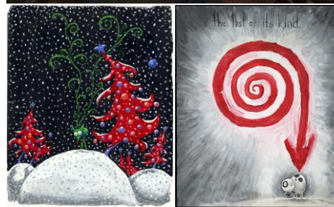
(下左)無題(『雪の中のトナカイ』)1994-1999年頃 ©2014 Tim Burton (下右)絶滅寸前 1994年 ©2014 Tim Burton