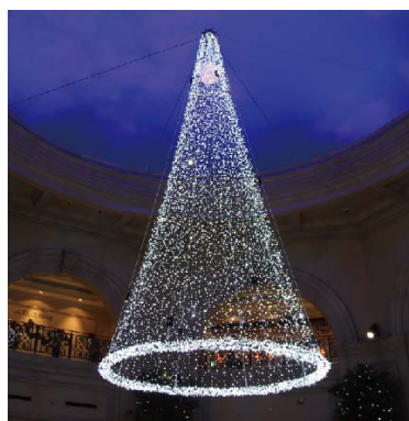
Spes's White tree A (希望のツリー)