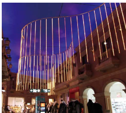
An aurora curtain (オーロラ・カーテン)