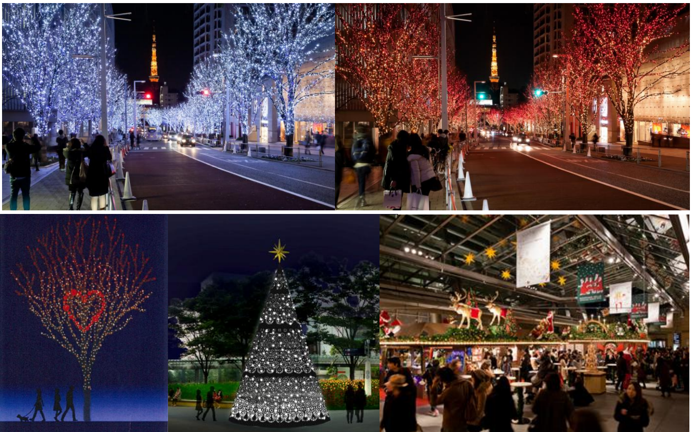
(左上)冬の風物詩となった樹氷の並木道。寒色系のイルミネーション“SNOW&BLUE” (右上)昨年に引き続き、暖色系のイルミネーション“CANDLE&RED”も点灯 (左下)今年にはけやき坂 GALAXY イルミネーションの中に Hidden Heart(隠れハート)が初登場 (中央下)66 プラザにも時間により表情が変わる新しいデザインのクリスマスツリーがお目見え (右下)人気のクリスマスマーケットには新店舗も登場

約400mの並木を彩るけやき坂 GALAXY イルミネーションは、約110万灯のLEDの放つ眩い光が街を包みます。今年は新しい演出として、直径2mのHidden Heart(隠れハート)を2箇所に設置し、1時間につき数回ずつ点灯する予定です。本リリースでは、クリスマスイルミネーション情報を中心に、ご案内申し上げます。