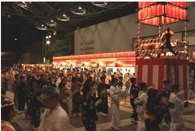
盆踊り(昨年の様子)

日 時：9月12日(金)11:00-21:00、13日(土)・14日(日)10:00-20:00 場 所：アーキヒルズ内 アーク・カラヤン広場 主 催：森ビル株式会社、アーキヒルズ自治会 協 賛：ANA インターコンチネンタルホテル東京 ※入場無料、雨天決行/荒天中止