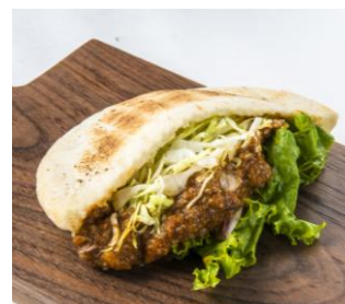
(左) ウルフギャング・パック ピッツァバー 「フォレストチキンバーガー・フレンチフライセット」