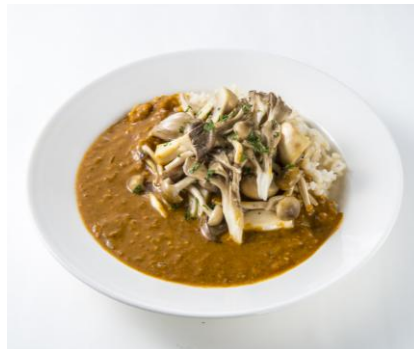
グルメ屋台メニュー オーガニックハウス 「4種のキノコカレー」