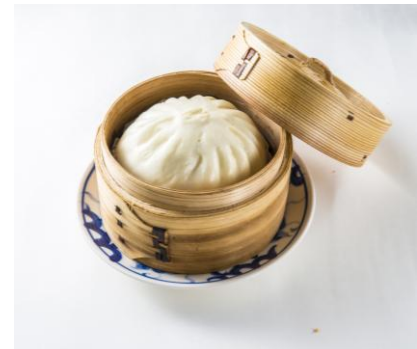
グルメ屋台メニュー 中国名菜 陳麻婆豆腐 「きのこ入り肉まん」