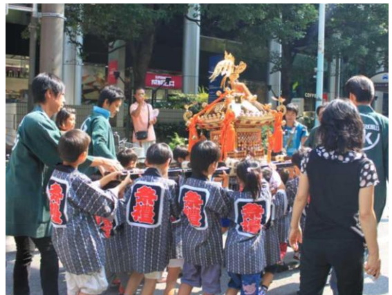
子ども神輿(昨年の様子)