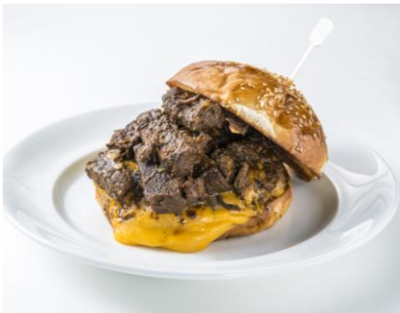
グルメ屋台メニュー パピーズ ニューヨーク アークヒルズ 「ビーフチリチーズバーガー」