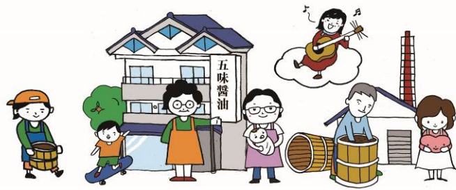
tontonworkshop by 五味醤油 ～Let's 手前味噌！～ ☆大きなお子様+大人編☆