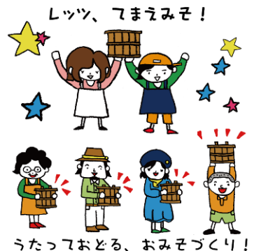
tontonworkshop by 五味醤油 ～Let's 手前味噌！～ ☆小さなお子様編☆