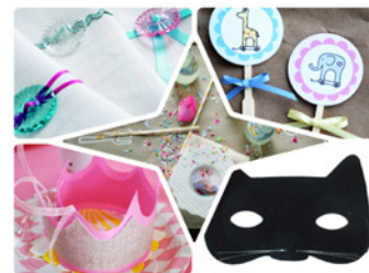
テーブルデコレーションワークショップ

9月中は、「キッズの森」や「OMOTESANDO HILLS POCKET」にて、5周年をお祝いする楽しいワークショップが目白押し。子どものためのアート情報誌「tonton」によるワークショップは、食の循環を楽しく知ることのできる“体の仕組みキット”の作成と、手作り手前味噌作り体験を実施。その他、家庭の食卓を彩る“テーブルデコレーション”のワークショップでは、最後に中南米伝統のお祭りに倣って、お菓子やおもちゃの詰まったくす玉人形“ピニャータ”を割り、みんなで5周年をお祝いします。