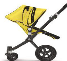
Bugaboo Cameleon 3