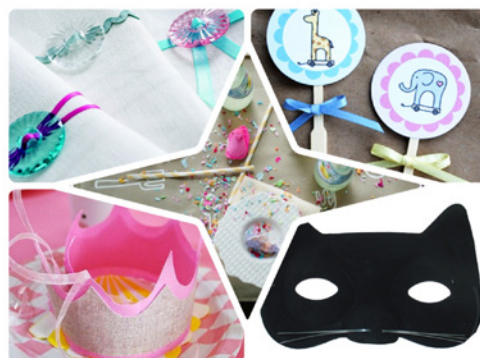
テーブルデコレーション ~Welcome to my party~