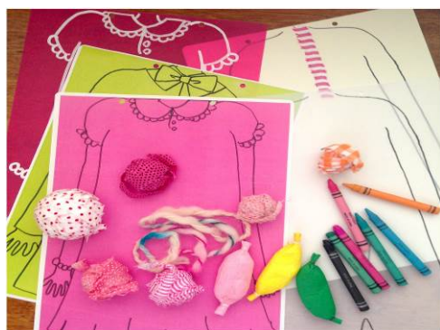
tontonworkshop by cocorocoro 「ぼく、わたしのからだのしくみ」