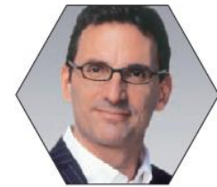
ガー・レイノルズ