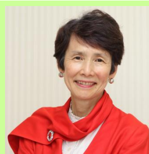
石倉洋子(一橋大学名誉教授)