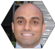
サンジーヴ・シンハ

『プレゼンテーションZen』の著者ガー・レイノルズ氏。禅を取り入れ、シンプルシティを追求した手法で、発信力を高めます。