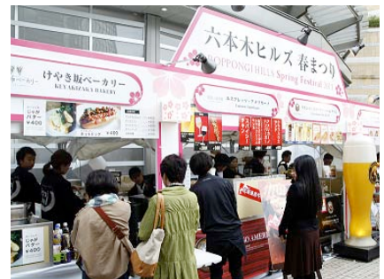
昨年の春まつりの様子