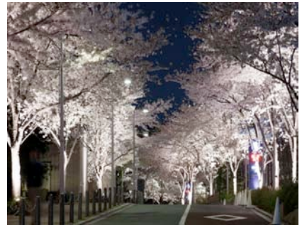
六本木さくら坂の夜景