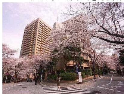
700mにおよぶ桜のトンネル