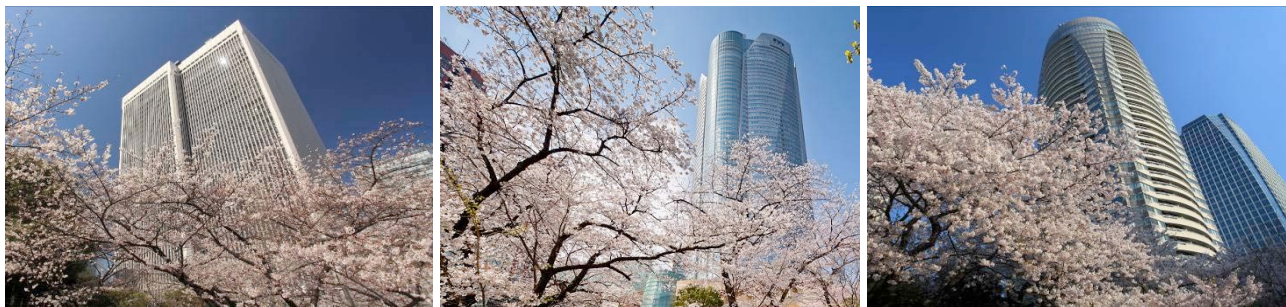
(左)アークヒルズ (中央)六本木ヒルズ (右)愛宕グリーンヒルズ

古来より咲き続ける大木や開発とともに植樹した苗木など、計約300本の桜は、夜桜を楽しむためのライトアップも開花とともに実施します。