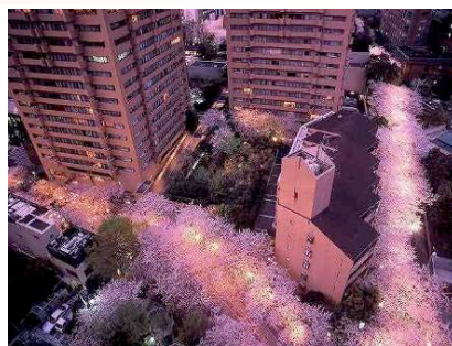
ライトアップされた幻想的な夜桜