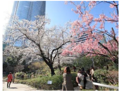
六本木ヒルズの開業以前から咲く桜