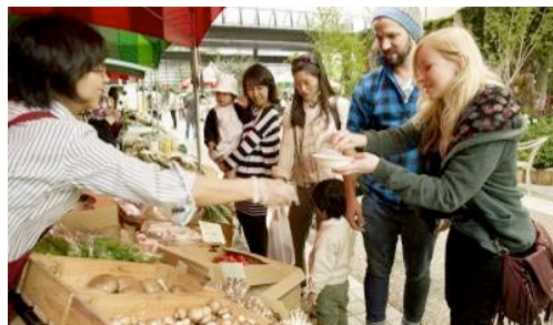
ヒルズマルシェの様子