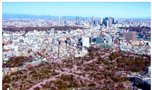
展望台から見渡す青山霊園の桜並木の十字路