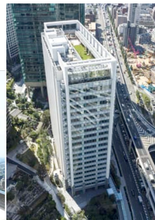
アークヒルズ サウスタワー