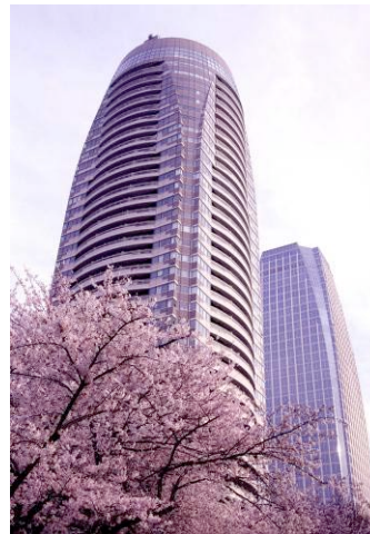
夕焼けに染まる桜