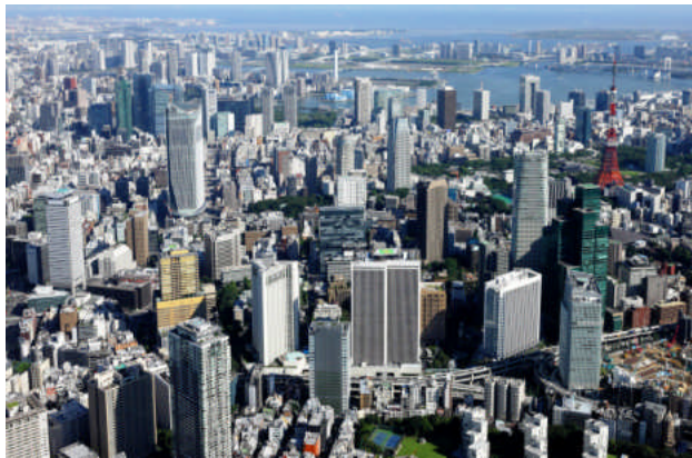
真の国際都市形成に向け進化するアークヒルズエリア

当エリアおよび周辺では今後、当社が関わる「虎ノ門ヒルズ(環状二号線Ⅲ街区計画)」(2014年竣工予定)のほか、他事業者による様々な開発プロジェクトも進行中です。オフィスはもちろん、住環境としても利便性、環境性、文化性に優れた魅力あふれる都市としての基盤整備が着実に進行、真の国際都心形成が加速してまいります。