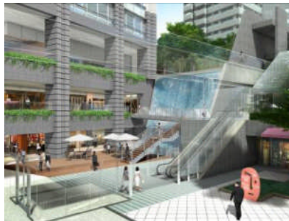
地下1階「アークキッチン」に面する「サンケンガーデン」(イメージ)