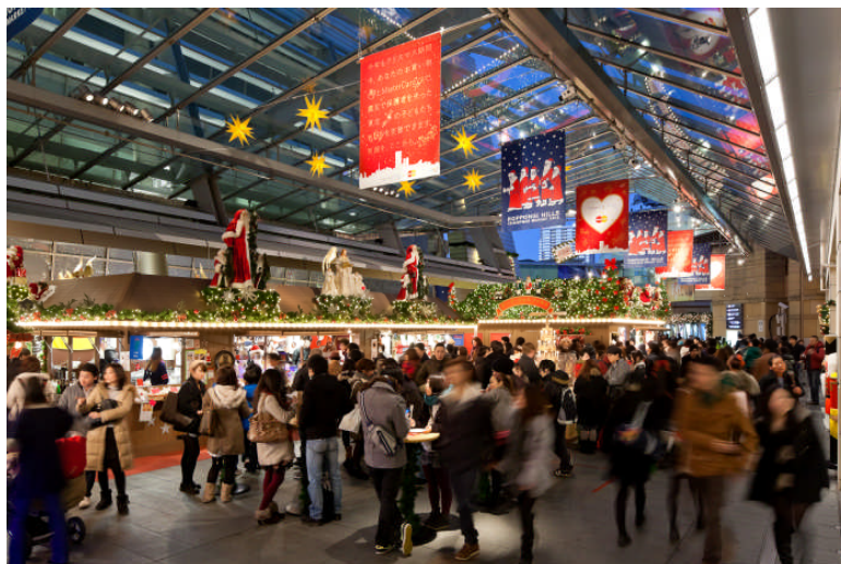
大屋根プラザ「クリスマスマーケット」(2012 年)