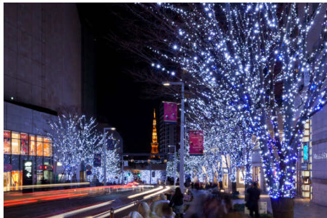
SNOW & BLUE のイルミネーション(2012 年)