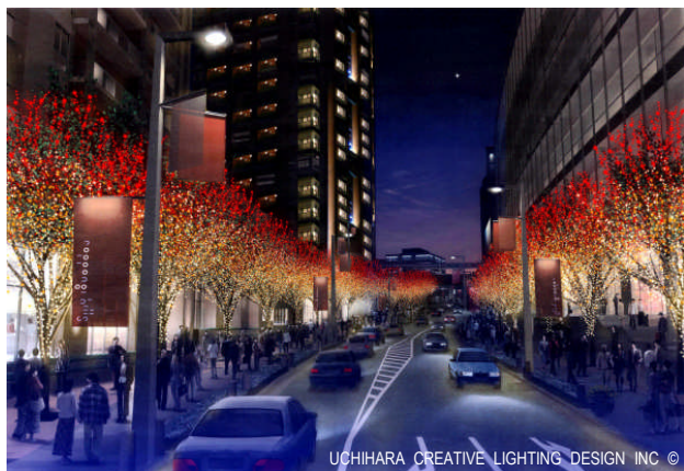
セレブレーションカラーのイルミネーション(イメージ)