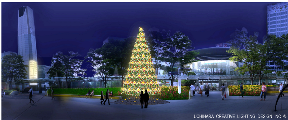
66 プラザイルミネーション（イメージ）