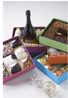
10周年 特別ハンパー

期 間： 11月14日(木)～12月25日(水) 場 所： グランド ハイアット 東京