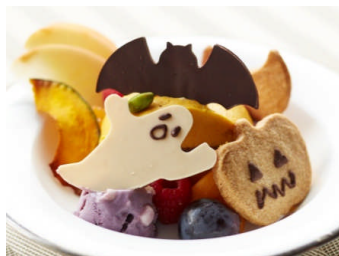
デルレイ カフェ & ショコラティエ

飲食店11店舗では、かぼちゃを使った限定メニューを提供します。ハロウィーンの夜をイメージした「ラーメンゼロ PLUS」の“黒い”味噌ラーメンや、かぼちゃの Pasta・コロッケ・スープが味わえる「洋食ミヤシタ」のパンプキン三昧プレートのほか、ハロウィーンモチーフのデコレーションが楽しい「デルレイ カフェ & ショコラティエ」の本格デザートなど、見た目にも味にもこだわった、表参道ヒルズならではの限定メニューをお楽しみ頂けます。また、物販各店舗でも、ハロウィーン気分を盛り上げるアイテムをご用意しています。