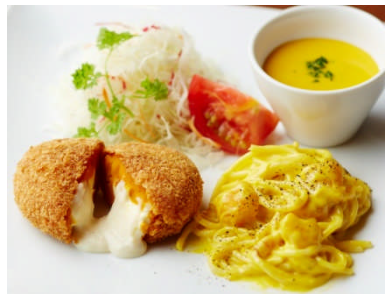
洋食ミヤシタ (本館 3F) パンプキン三昧プレート ¥2,600 (税込)

契約農家から直送される、旨みが凝縮されたえびすかぼちゃとチーズを入れてコロッケにしました。ホクホク、とろとろの食感をお楽しみ頂きます。※提供時間 17:00~L.O.