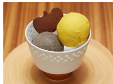
トラヤカフェ (本館 B1F) 豆乳アイスクリーム【かぼちゃ/黒ごま】 ¥840 (税込)

紫イモのアイスクリームにカボチャのムースや色鮮やかなフルーツをトッピング。デコレーションのおぼけたちがお皿の中でパーティーを楽しんでいます。※提供時間 14:00~L.O.