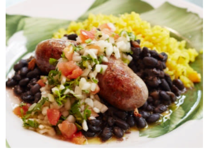
フォービドゥン フルーツ (西館 1F) ブラジリアンスパイシーリングイッサ & パンプキンハーブライス ¥950 (税込)

おいっぱいに広がる栗かぼちゃの旨みとBIOのハチミツの甘みが特徴。リコッタチーズのアクセントが絶妙です。※提供時間 17:00~L.O.