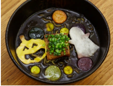
ラーメンゼロ PLUS (本館 3F) ホーンテッドラーメン ¥1,200 (税込)

おぼけやランタンをあしらひ、ハロウィーンの夜をイメージしたラーメン。竹墨を混ぜた味噌と野菜のペーストの特製スープが麺によく絡みます。※各日 10 食限定