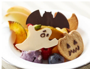
デルレイ カフェ & ショコラティエ (本館 3F) デルレイハロウィーンパーティー ¥1,260 (税込)

コクのあるかぼちゃの深い味わいとホクホクとした食感を感じられるアイスクリーム。香ばしいコーンフレークとキャラメルソースがアクセント。