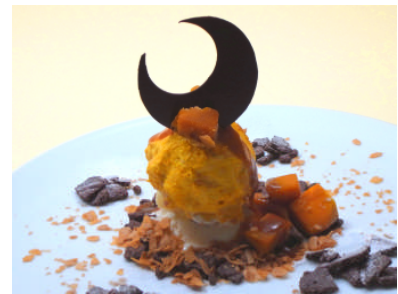
レーゼン ヴァルト (本館 B3F) モントリヒト ¥1,200 (税込)

クリーミーで濃厚な味わいのかぼちゃのカルボナーラ(カボチャナーラ)と、コロッケ、スープの三点がセットになったプレート。かぼちゃの旨みを存分に楽しめる一皿です。※各日 10 食限定