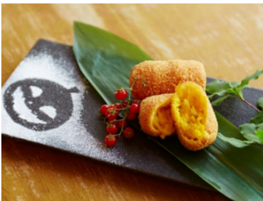
やさい家めい (本館 3F) ホクホクとろとろかぼちゃコロッケ ¥700 (税込)

フェジョアードというブラジルの郷土料理をフォービドゥン風スパイスにアレンジ。ジューシーな自家製ソーセージとハーブやガーリックが効いたパンプキンライスが食欲をそそります。