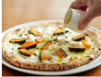
サルヴァトーレ クオモ (本館 3F) 栗かぼちゃとイタリア産リコッタチーズのピッツァ BIOハチミツ添え ¥1,600 (S)、¥2,000 (M) (税込)

おぼけやランタンをあしらひ、ハロウィーンの夜をイメージしたラーメン。竹墨を混ぜた味噌と野菜のペーストの特製スープが麺によく絡みます。※各日 10 食限定