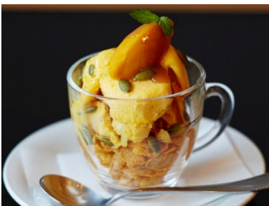
ゴールデンブラウン (本館 3F) 栗かぼちゃのアイス ¥680 (税込)

濃厚なかぼちゃとバニラのアイスにたっぷりのキャラメルソースとサクサクチョコのハーモニー。月明かりをイメージしたデザートです。