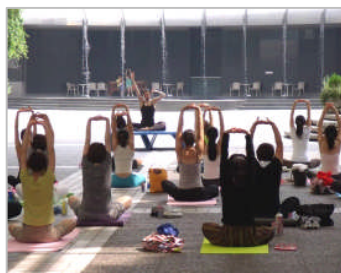
アークヒルズ「朝フィットネス」<イメージ>