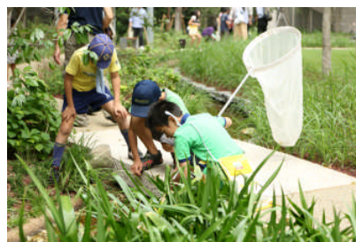
アークヒルズ 仙石山森タワー「こげらの庭」