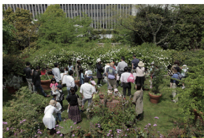
アークヒルズ「ルーフガーデン」

「みどりの日」に合わせて、通常非公開であるアークヒルズの「ルーフガーデン」で、四半世紀の歳月を経て育った屋上庭園を探検。また、昨年8月竣工の「アークヒルズ 仙石山森タワー」では、自然の中で親子ヨガをお楽しみいただき、レクチャーとあわせて、都心の緑の重要性を体験いただけるプログラムです。