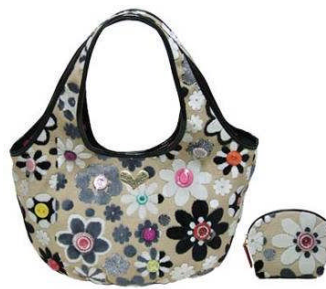
Think Bee !