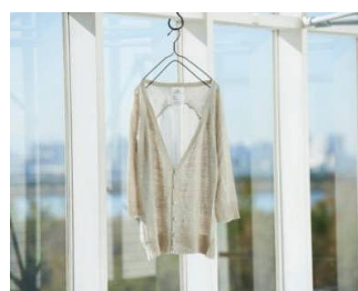
BRAIDS & BEYOND TOKYO