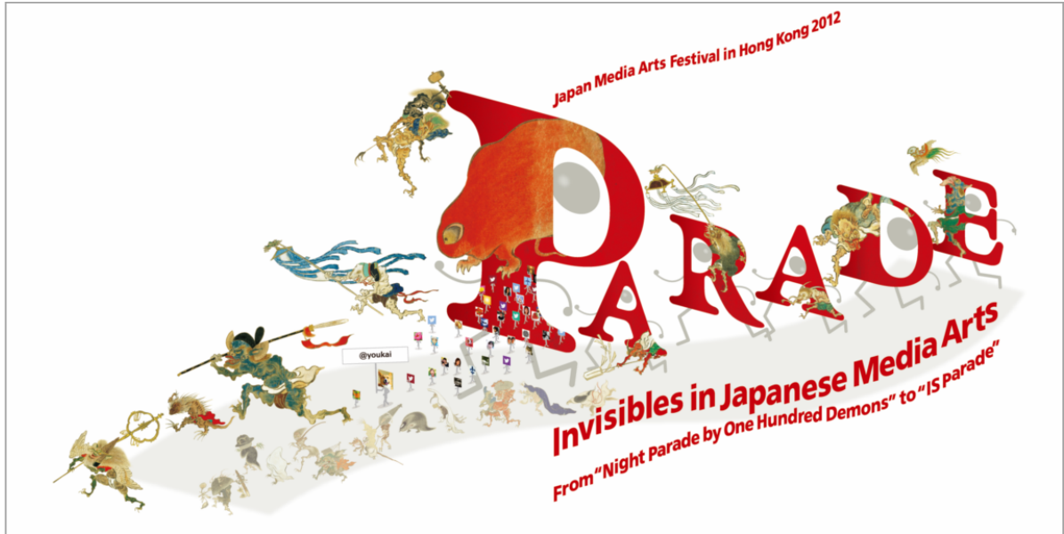
PARADE 展ビジュアルイメージ (変更となる可能性があります)

「PARADE」展では、現代アート、マンガ、アニメーション、ゲーム、ウェブ、アプリ作品など日本の現代アート、メディア芸術分野から、日本の自然観や見えない存在への意識が視覚化された作品を紹介します。タイトルの「PARADE」は、日本美術史上の代表的な妖怪絵巻である《百鬼夜行絵巻》(真珠庵本、伝 土佐光信 筆)全図(複製)の「行列(パレード)」と、twitter 上でキャラクターを作成する《IS Parade》の行列を繋ぐキーワードです。同時に、過去から現在に至るメディアやテクノロジーの変遷と、そこに通底する空間と時間の融合、連続性の概念、不可視の存在への意識などを探る旅の象徴でもあります。