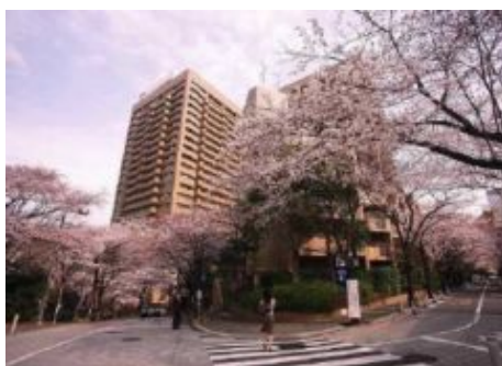
さくら坂～スペイン坂 桜のトンネル