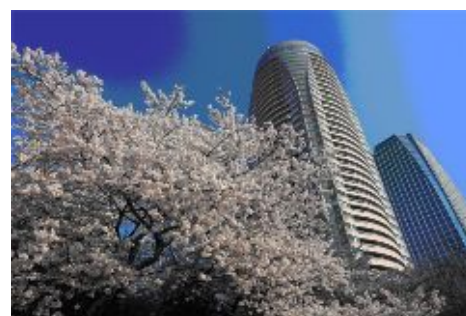
愛宕グリーンヒルズ