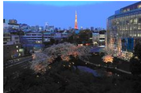
毛利庭園の桜のライトアップ