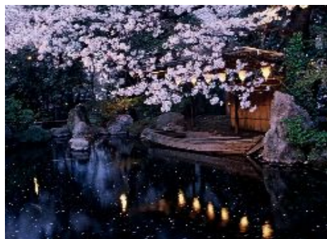
愛宕神社境内の 桜のライトアップ