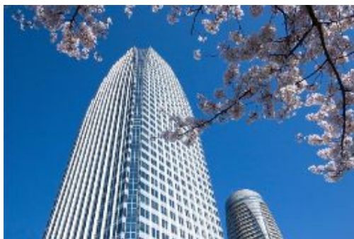
愛宕グリーンヒルズ