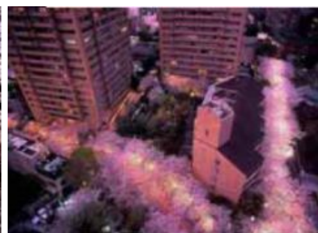
ライトアップされた 幻想的な夜桜