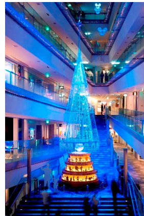
<左> 昨年の六本木ヒルズのイルミネーションの様子