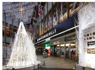
メインエントランス(昨年の様子)