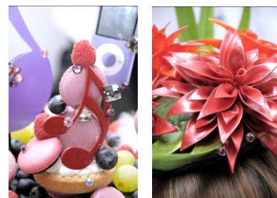
スイーツオブジェ(イメージ)