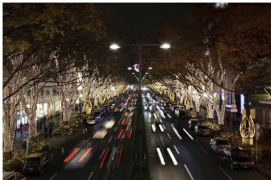
昨年のイルミネーションの様子