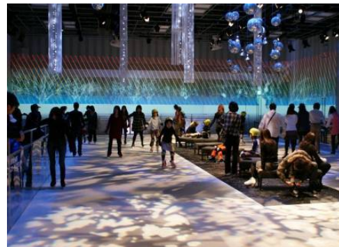
昨年のスケーティングシアターの様子