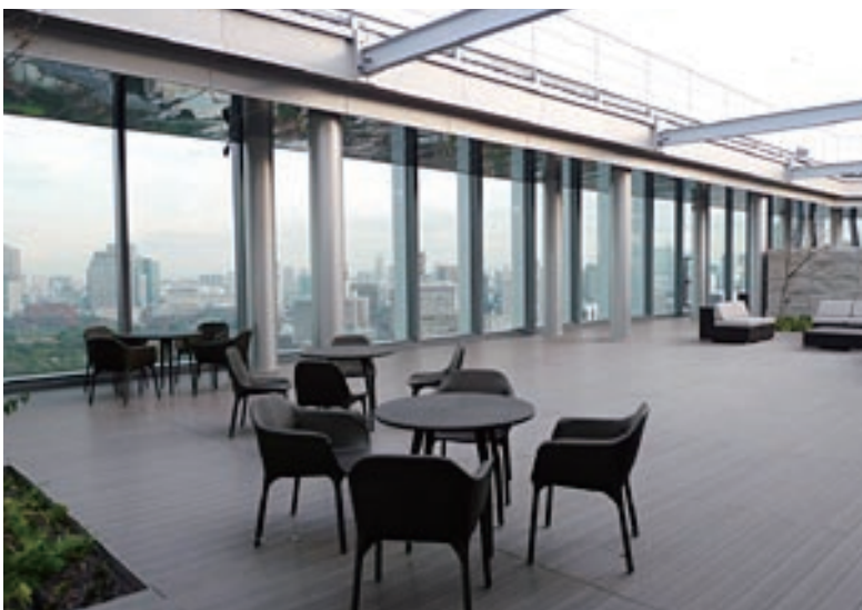
ルーフガーデン全景

また、ランナーの聖地、皇居に至近のビル1階には専用施設「adidas RUNBASE(アディダスランベース)」があり、豊かなランニングライフを手軽に楽しむことも可能。ライブラリーを併用することで、アクティブで効率的な「オン」と積極的にリラックスする「オフ」を両立させる都心の拠点をご堪能いただけます。