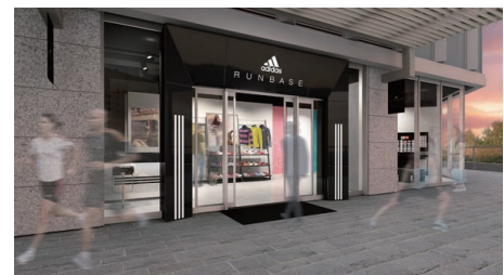
アディダスランベース入口