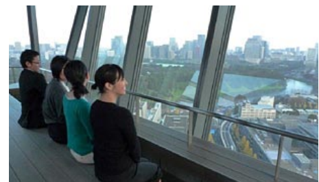
眺望を楽しめる足湯設備