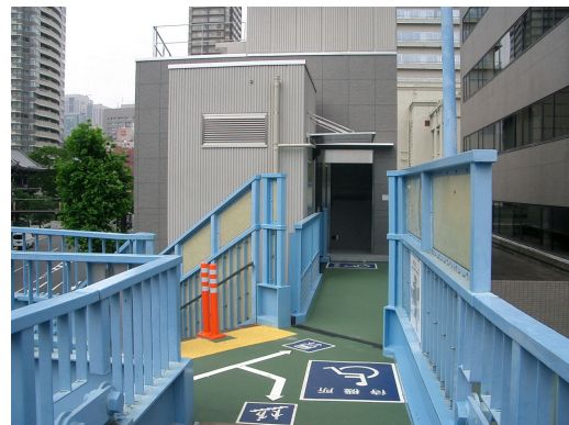
新設したエレベーターとデッキ