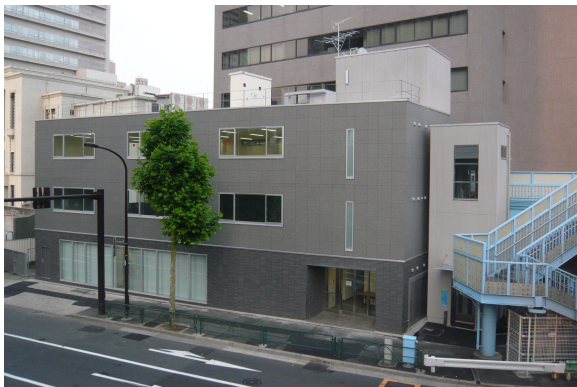
「愛宕ヒルズサイド」外観

隣接する愛宕グリーンヒルズ（2001年竣工）では、オープン当初から歩道橋へ直接アクセスするスロープを設置し、エリアの利便性向上を図ってまいりました。当エレベーターの設置により、車椅子やご高齢の方、ベビーカーをご利用の方でも東京メトロ神谷町駅からスロープ、歩道橋、エレベーターを利用して東京慈恵会医科大学附属病院へスムーズにアクセスできるようになるなど、さらにエリア全体の利便性が向上します。また、エレベーターカゴ内の24時間監視を実施するなど、セキュリティにも配慮しています。