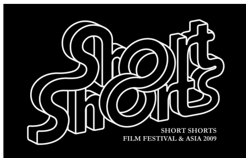
SHORT SHORTS FILM FESTIVAL & ASIA 2009

今後も、日本のファッションや文化の中心としてトレンドを発信し続けているストリート・表参道を代表するランドマークとして、地域や環境への貢献をさらに強化し、高感度なファッション、文化、アートを発信する文化商業施設として進化し続けて参ります。