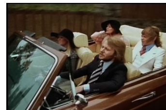
スウェーデンプログラムより ABBA-Money, Money, Money

スウェーデンの2大巨匠、ラッセ・ハルストレムとイングマール・ベイルマン監督作品をはじめ、スウェーデンの魅力満載のショートフィルムを紹介。