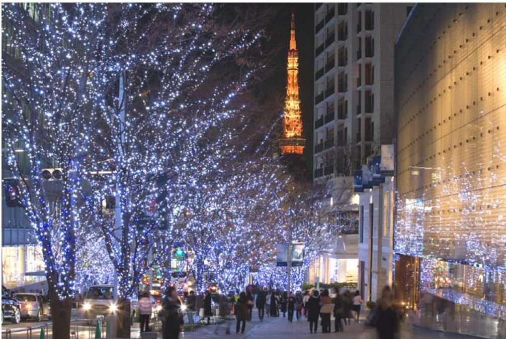
六本木ヒルズ（六本木けやき坂通り）のイルミネーション

イルミネーションの照明はLED（約90万球）を使用し、省エネルギーに貢献。また、六本木ヒルズ（けやき坂、66プラザ、毛利庭園、ミュージアムコーン、商業施設）のイルミネーションで使用する電力は、グリーン電力でまかない、「エコ」なイルミネーションとなっています。